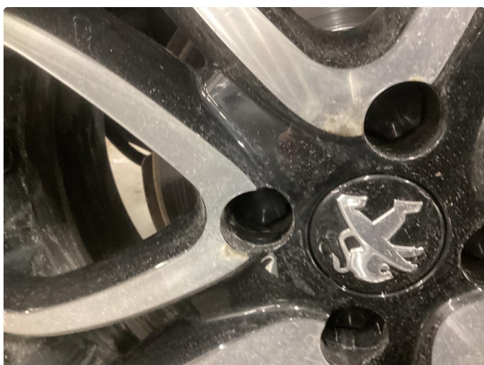
1.3 Påbegynnende oksidering