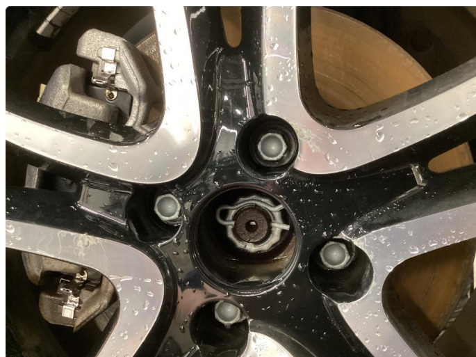
1.3 Påbegynnende oksidering