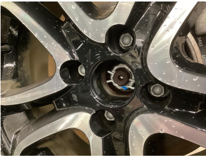
1.3 Påbegynnende oksidering