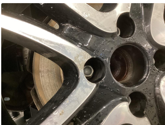
1.3 Påbegynnende oksidering