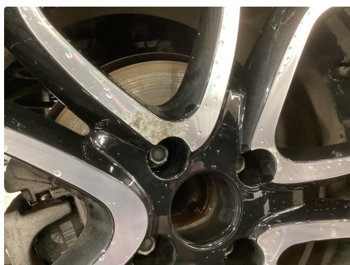
1.3 Påbegynnende oksidering