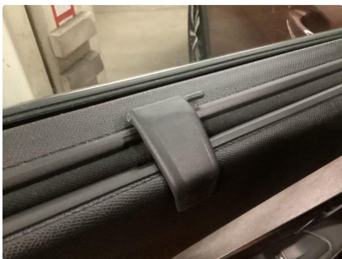
2.1 Solskjerm skadet