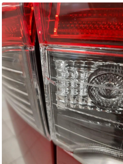
2.1 Øvrige feil