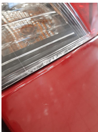
2.1 Øvrige feil