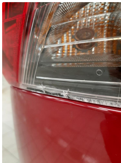
2.1 Øvrige feil