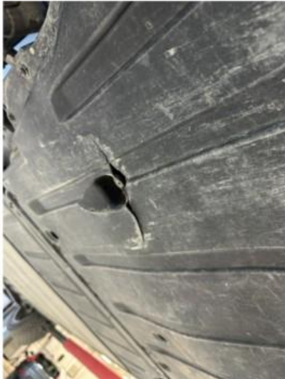
1.1 Sprekk i beskyttelsesplate under bilen. Normal slitasje