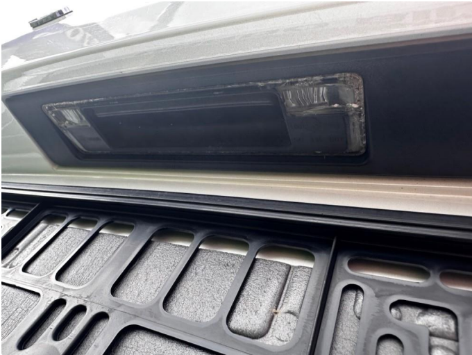
1.1 Skiltlys bak byttet