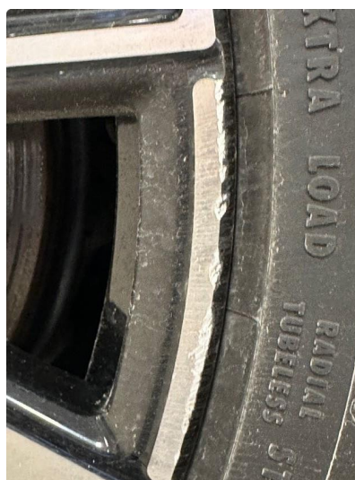
1.1 En vinterfelg litt kantkjørt