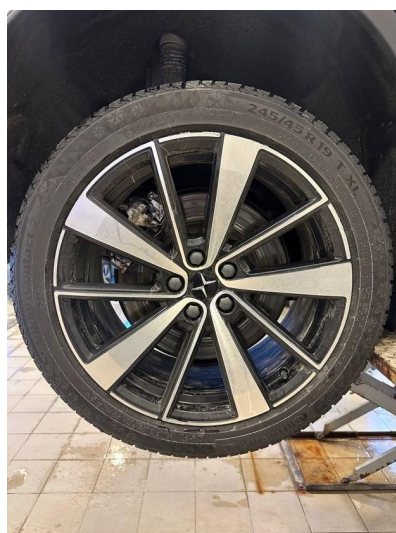
1.1 En vinterfelg litt kantkjørt