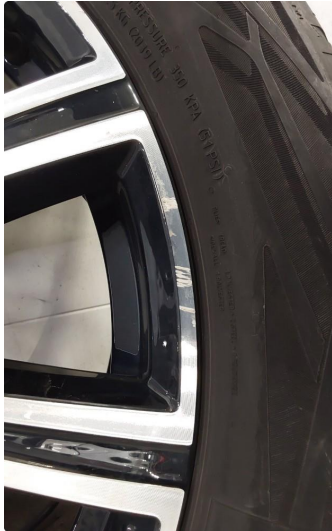
1.2 En sommerfelg litt kantkjørt