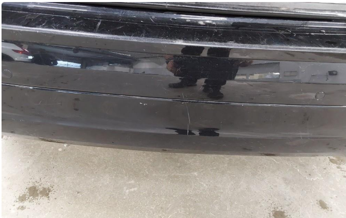
1.4 Noen riper i fanger bak