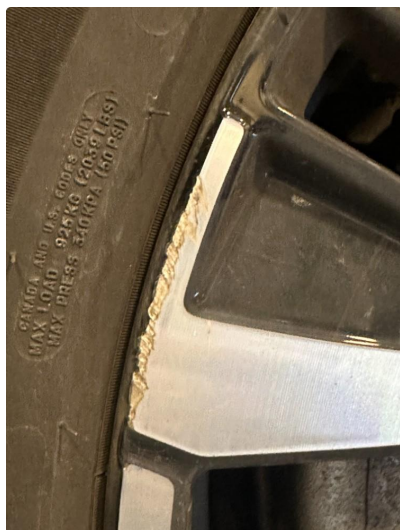
1.1 En sommerfelg litt kantkjørt