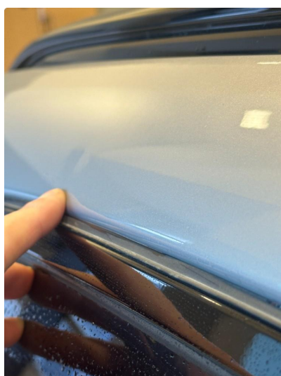
1.2 Liten bulk på tak høyre bak