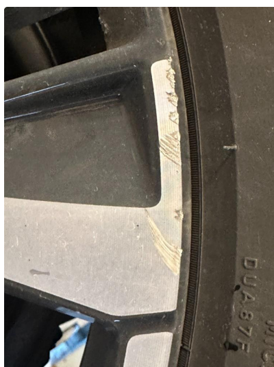
1.1 En sommerfelg litt kantkjørt