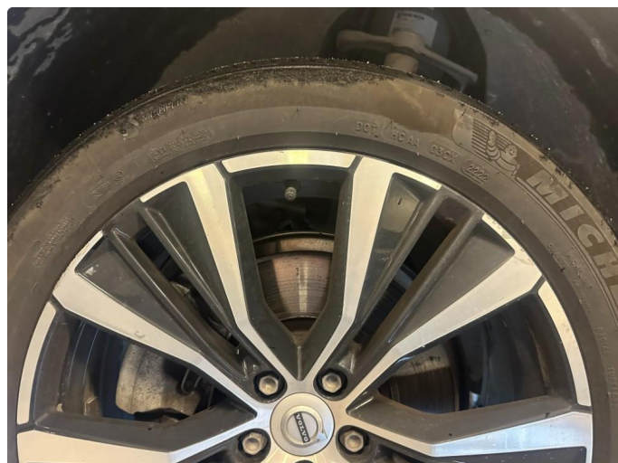
1.1 En sommerfelg litt kantkjørt