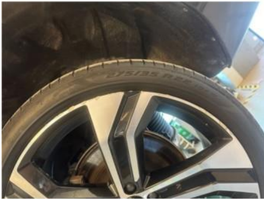
1.1 2 stk sommerfelger litt kantkjørt