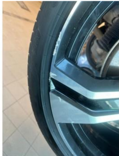
1.1 2 stk sommerfelger litt kantkjørt