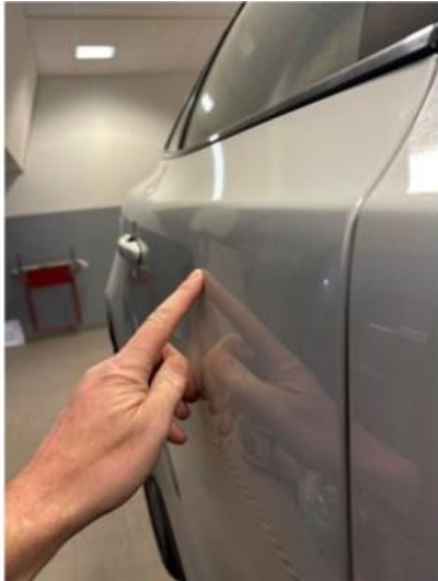
1.1 Liten p.bulk i dør høyre bak