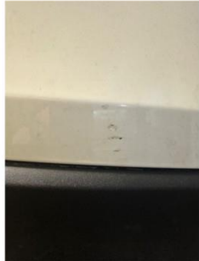
1.2 Små merker/riper i fanger bak