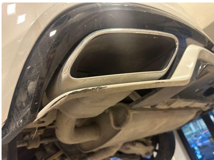
1.1 Litt oppriperet på underside av fanger foran og bak