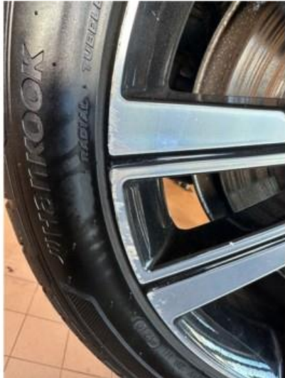
1.1 En sommerfelg litt kantkjørt