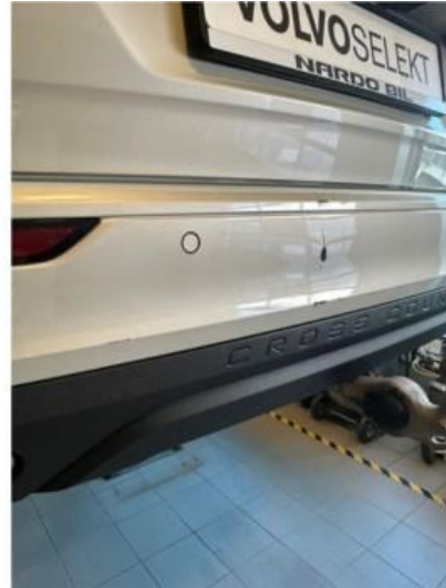
1.2 Liten skade i fanger bak