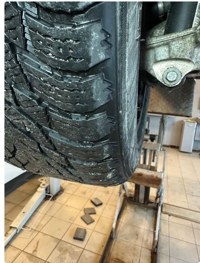
1.2 Skjev slitasje på vinterdekk