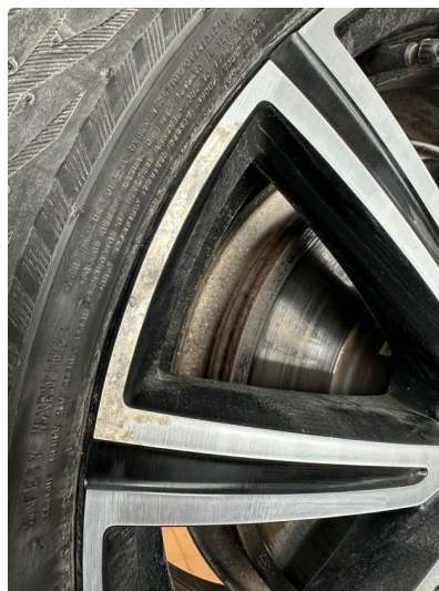
1.1 Påbegynnende oksidering på 3 vinterfelger