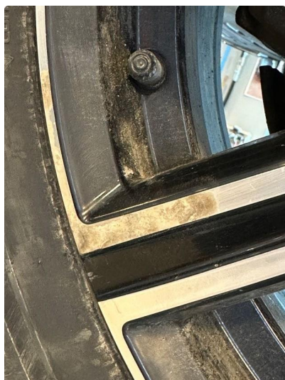
1.1 Påbegynnende oksidering på 3 vinterfelger