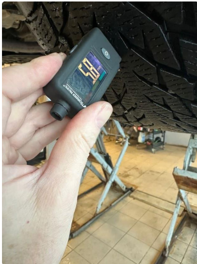
1.2 Skjev slitasje på vinterdekk