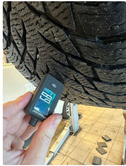
1.2 Skjev slitasje på vinterdekk