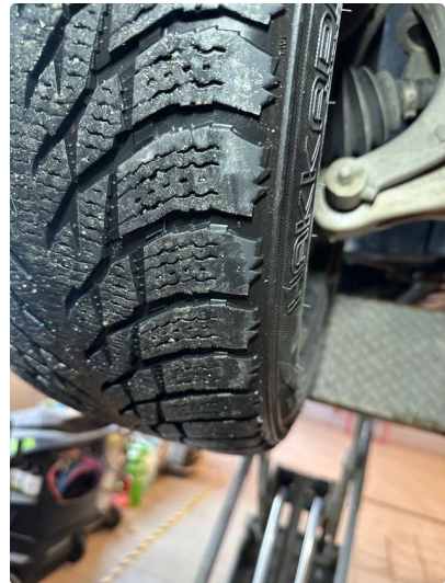
1.2 Skjev slitasje på vinterdekk