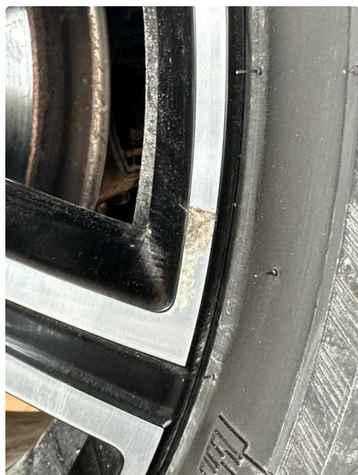
1.1 Påbegynnende oksidering på 3 vinterfelger