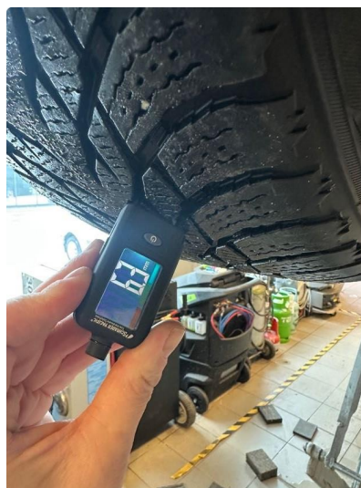
1.2 Skjev slitasje på vinterdekk