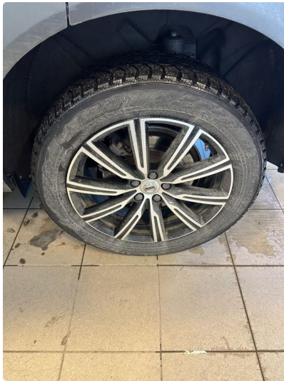
1.2 Skjev slitasje på vinterdekk