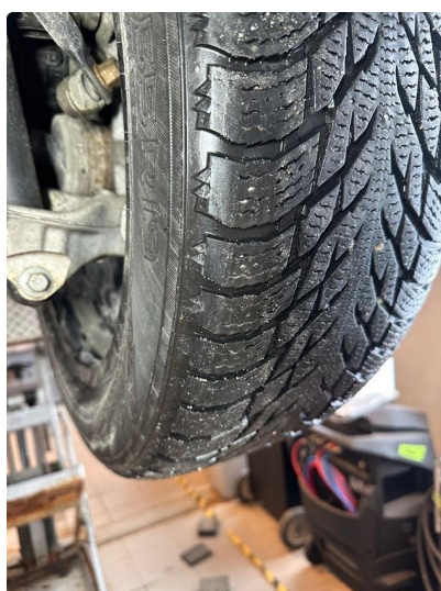
1.2 Skjev slitasje på vinterdekk