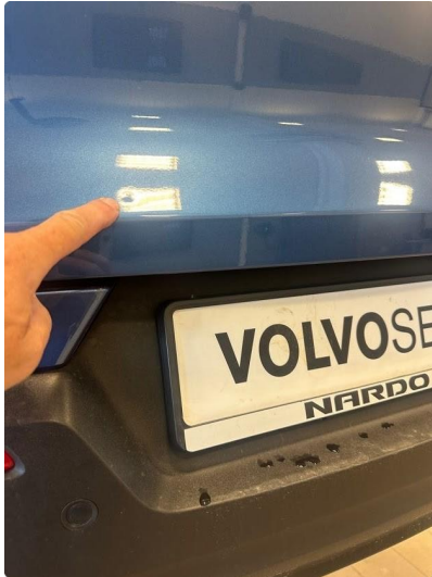
1.1 Liten bulk i bakluke