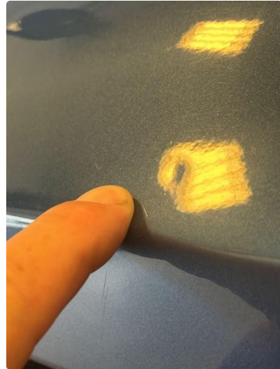
1.1 Liten bulk i bakluke