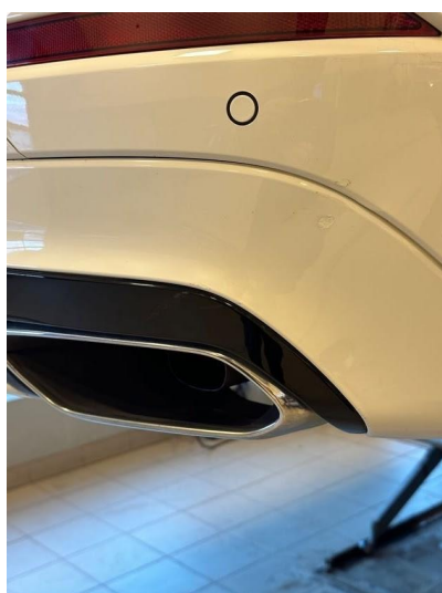
1.1 Noen små hakk i fanger bak