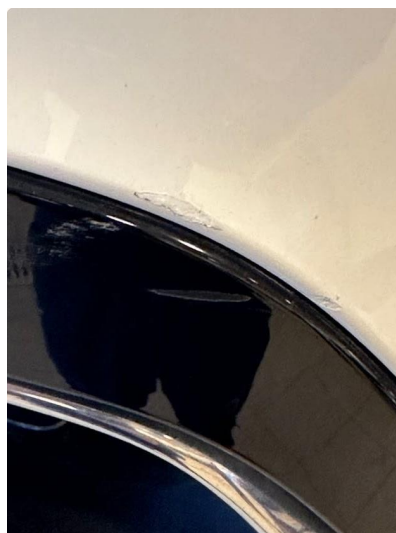
1.1 Noen små hakk i fanger bak