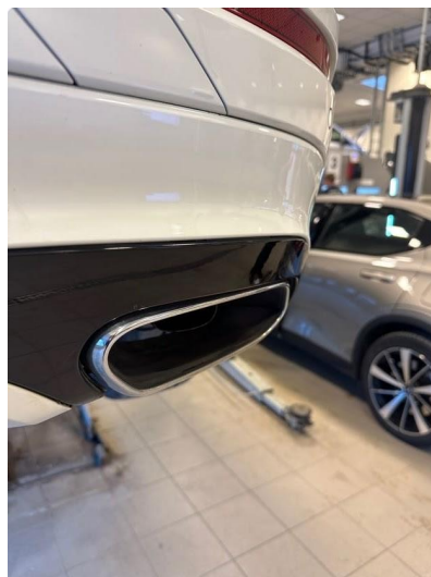
1.1 Noen små hakk i fanger bak