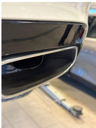
1.1 Noen små hakk i fanger bak