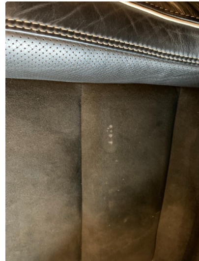
2.1 Skade på setetrekk