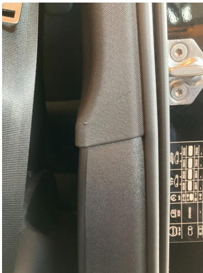
2.2 Liten skramme etter transport?