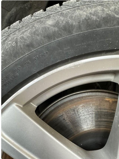
1.1 En vinterfelg ubetydelig kantskjørt