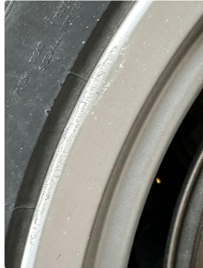
1.1 En vinterfelg ubetydelig kantskjørt