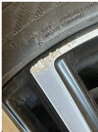
1.1 Noe kantkjørte sommerfelger, ett bilde av hver felg.