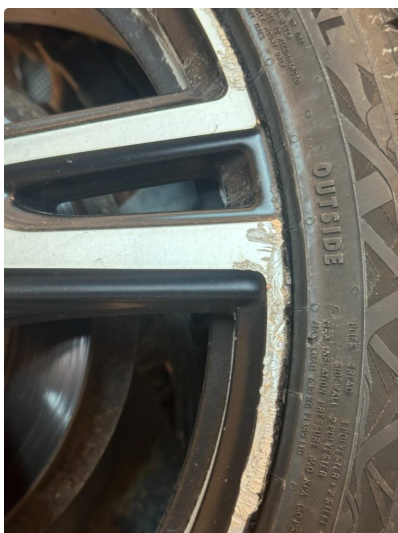
1.1 Noe kantkjørte sommerfelger, ett bilde av hver felg.