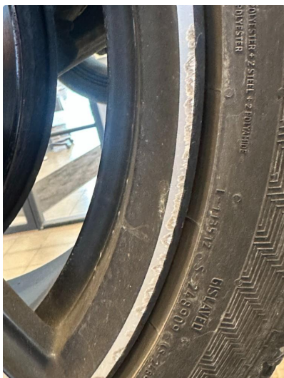
1.1 Noe kantkjørte sommerfelger, ett bilde av hver felg.