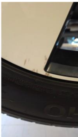
1.2 Liten felgskade på to av sommerfelgene