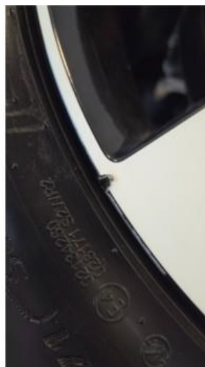
1.2 Liten felgskade på to av sommerfelgene