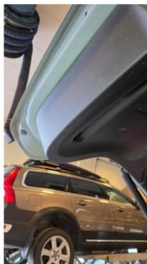
2.1 Ripe på innside av bakluke