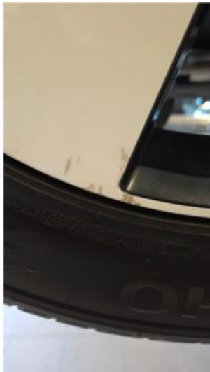
1.2 Liten felgskade på to av sommerfelgene