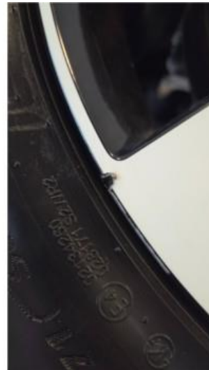
1.2 Liten felgskade på to av sommerfelgene