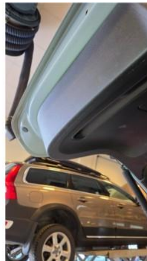
2.1 Ripe på innside av bakluke