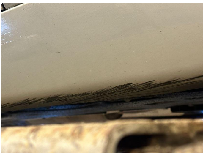
1.4 Noen riper/bulk i kanal venstre bak