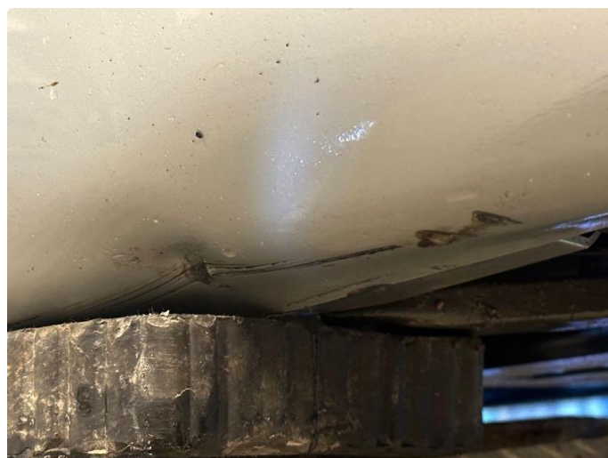
1.4 Noen riper/bulk i kanal venstre bak