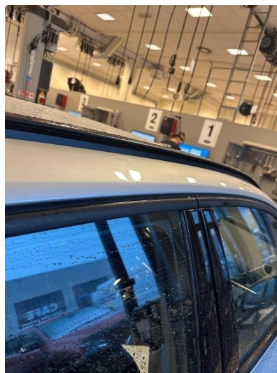
1.3 Liten skade på tak