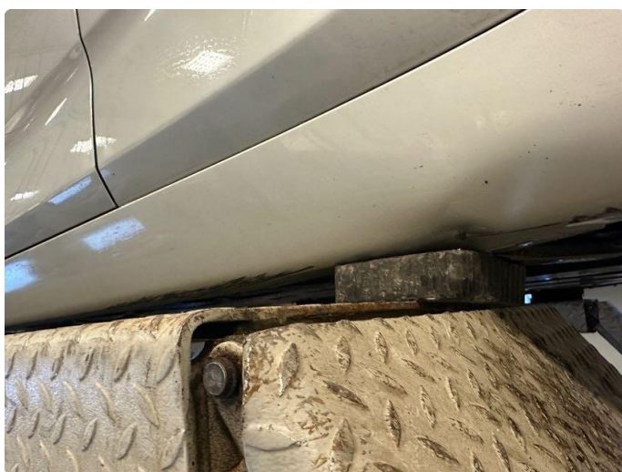
1.4 Noen riper/bulk i kanal venstre bak