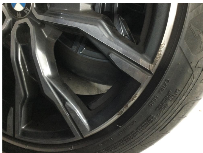
1.4 Kantkjørt felg