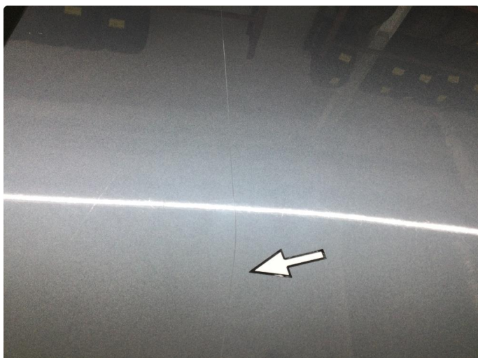
1.1 Ripe(r) ned til grunning