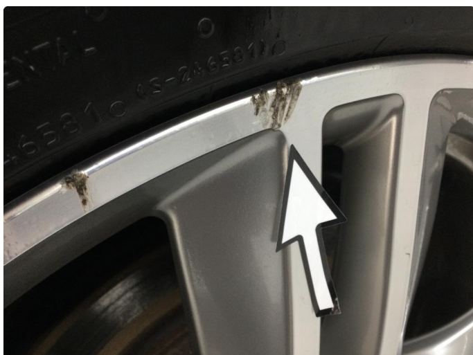
1.3 Kantkjørt felg