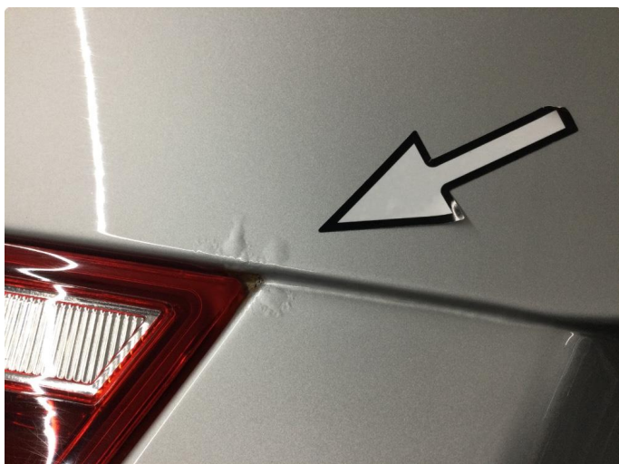
1.1 Rust i fals