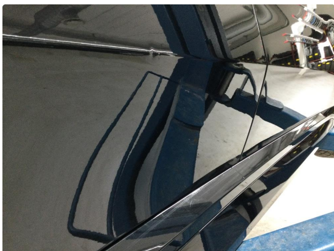
1.2 Bulk med lakkskade