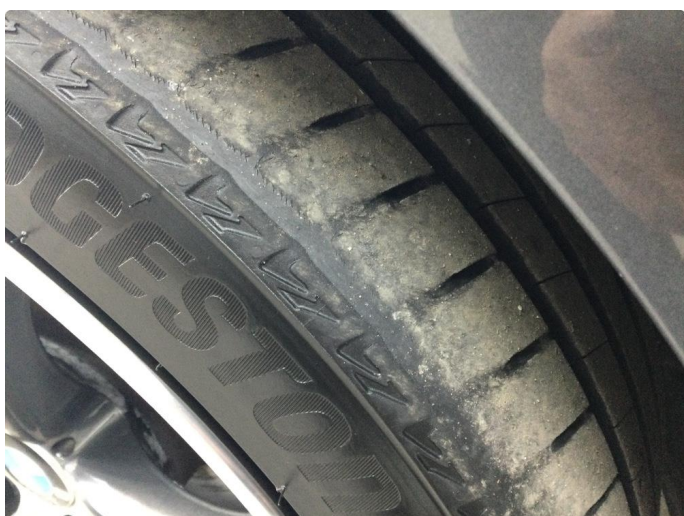
1.3 Skjev slitasje på sommerdekk