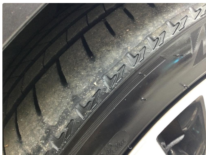
1.3 Skjev slitasje på sommerdekk