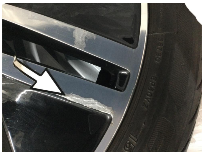
1.4 Kantkjørt felg