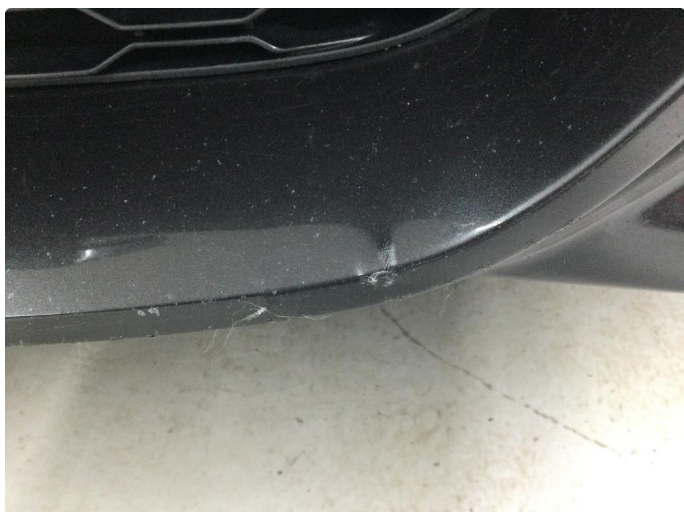
1.1 Liten skade på støtfanger foran + lakkering støtfanger bak