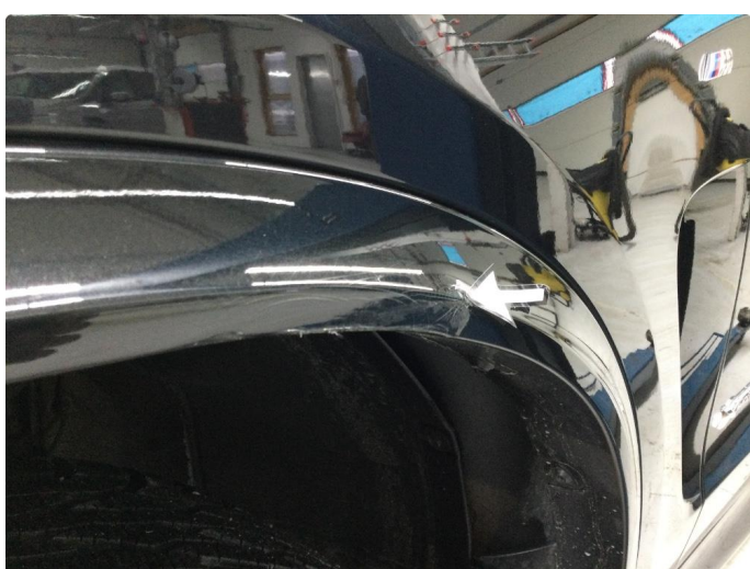
1.5 Plastinnerskjerm skadet