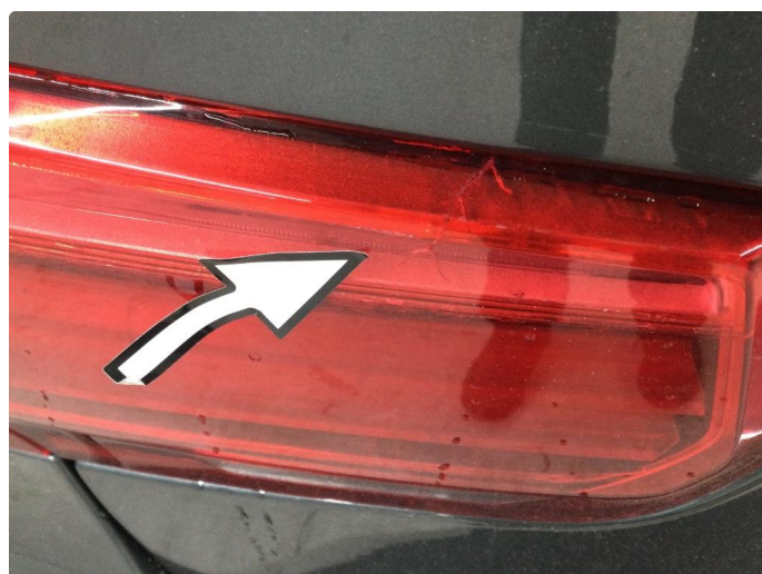
2.1 Defekt / sprukket glass