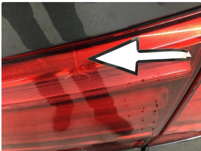
2.1 Defekt / sprukket glass