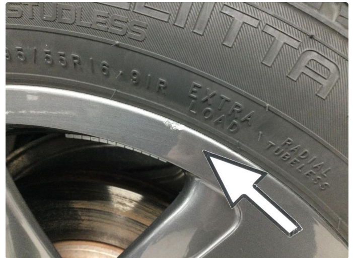
1.2 Skade på felg