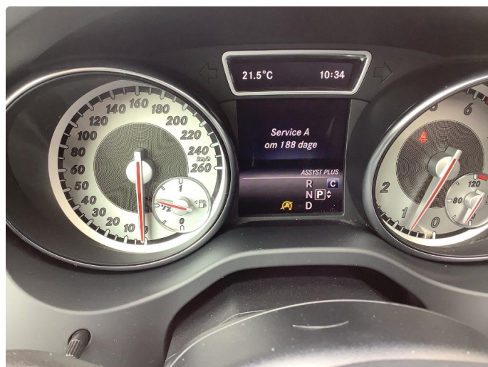
2.1 Trenger service