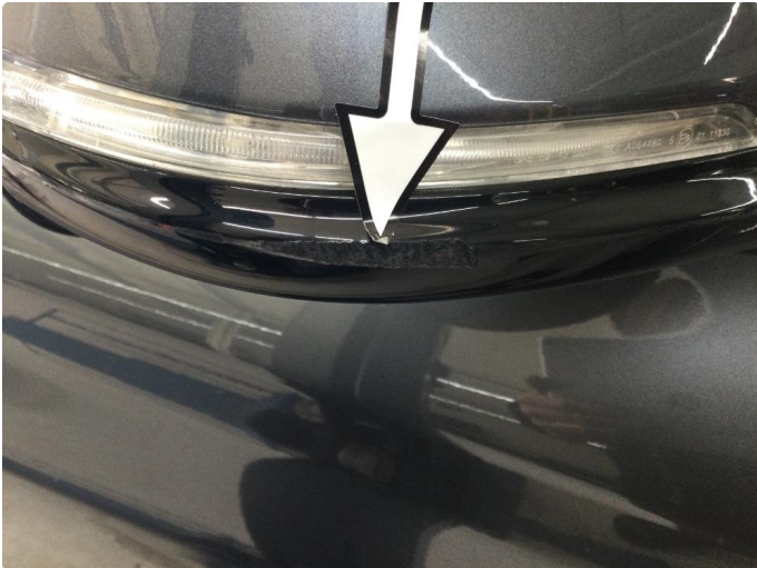
1.1 Deksel skadet/ripe