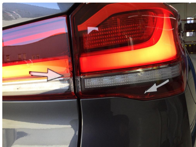
2.1 Krakelering - Garanti