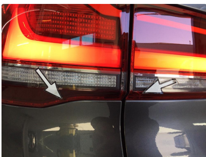
2.2 Krakelering - Garanti