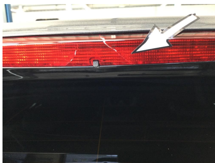
2.3 Krakelering - Garanti