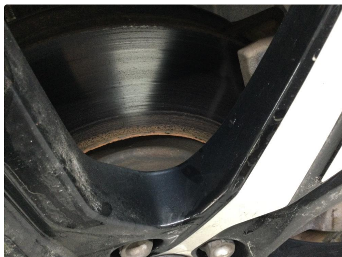
2.1 Mer enn 25% rust