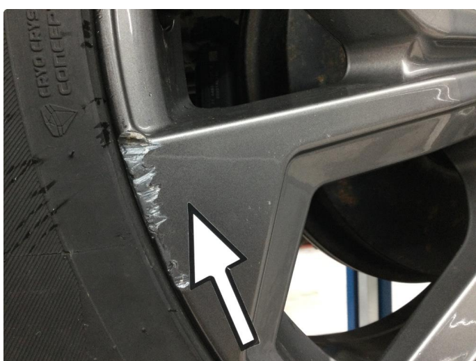
1.3 Kantkjørt felg