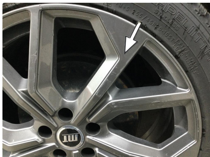
1.3 Kantkjørt felg