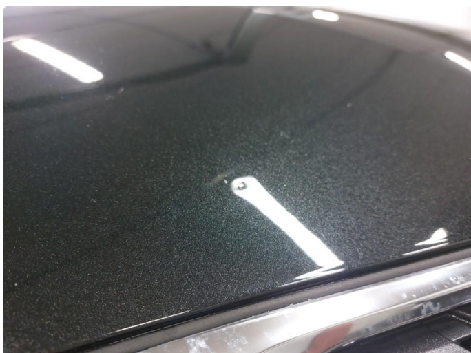
1.1 Liten steinsprut