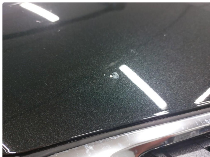
1.1 Liten steinsprut