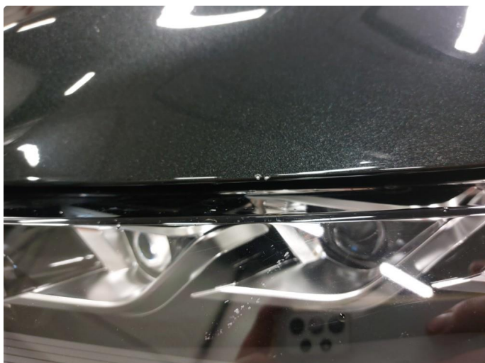
1.1 Liten steinsprut