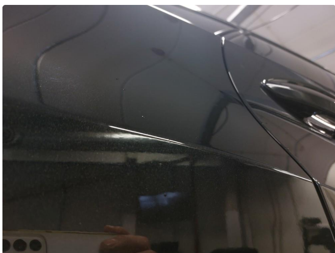
1.2 Liten bulk