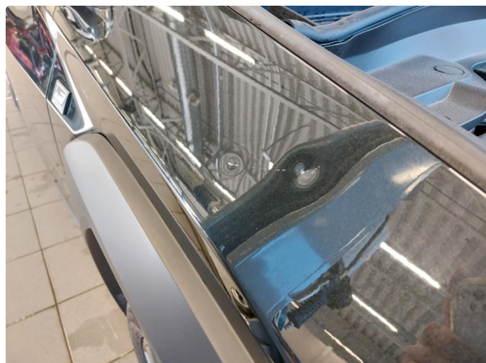
1.2 Bulk med lakkskade