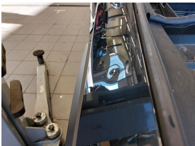
1.2 Bulk med lakkskade