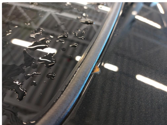
1.3 Steinsprut med rust