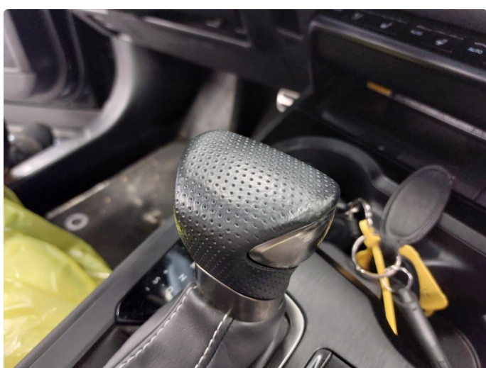
2.1 Slitasje på girspak