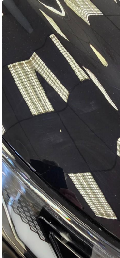
1.1 Liten stensprut ned ved panser