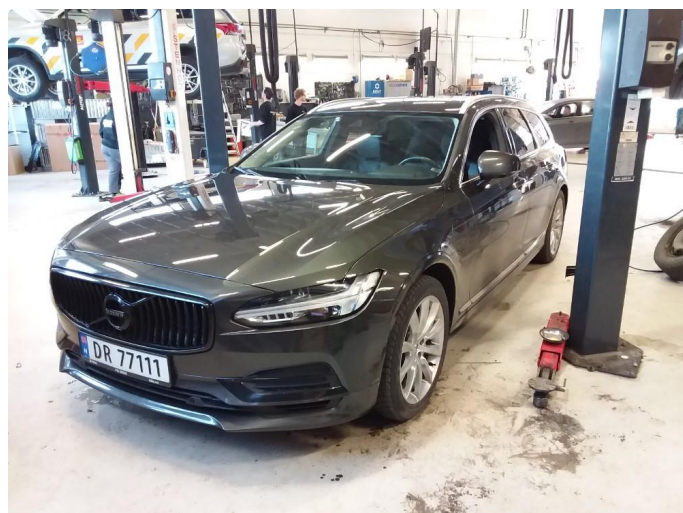
2.1 Full shine/ bruktbilklargjøring utført