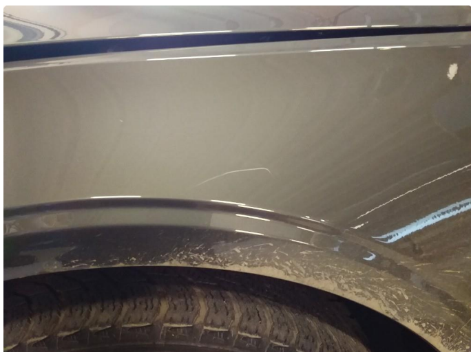
1.1 Ripe over hjulbuen