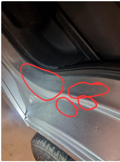
1.7 Noen riper og småbulker