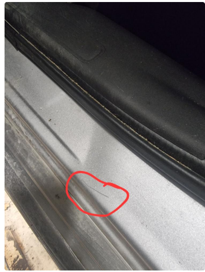
1.7 Noen riper og småbulker