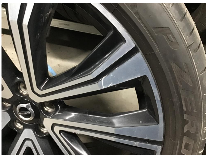
1.1 Noen få skraper i felg