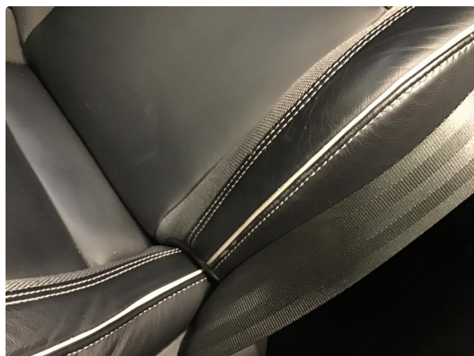
2.1 Liten slitasje etter inn og utstigning