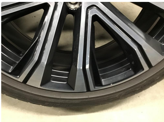
1.1 Noen få skraper i felg