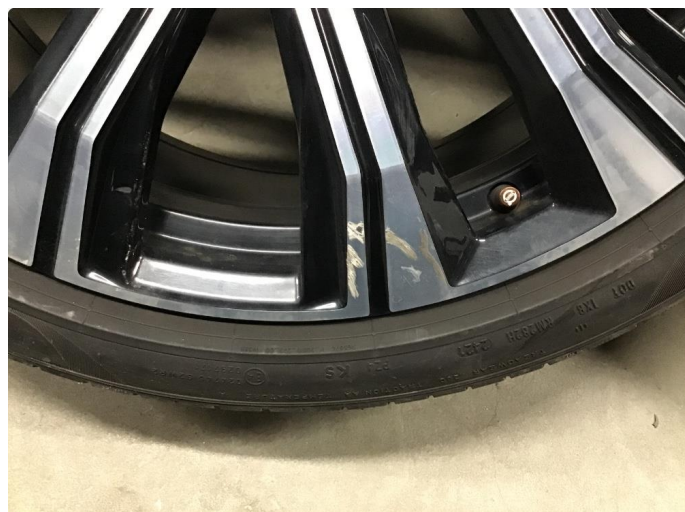
1.1 Noen få skraper i felg