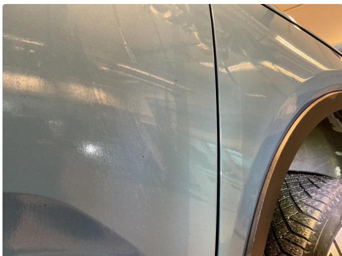
1.1 Bruksmerker i henhold til alder