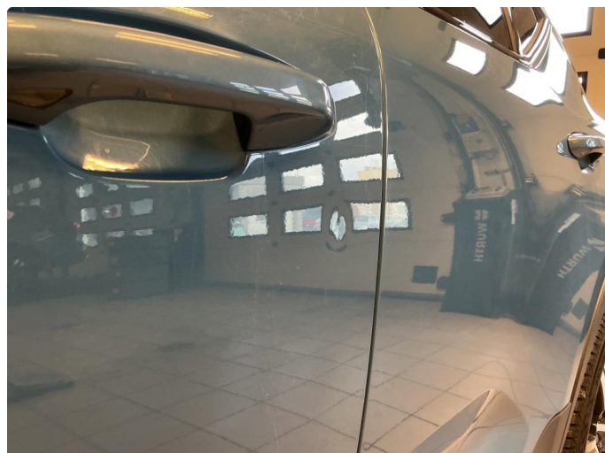
1.2 Liten parkeringsbukk