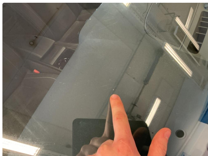
1.4 Små steinsprut frontrute