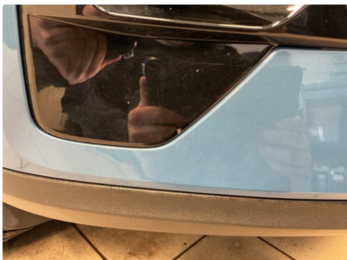
1.3 Noen små steinsprut støtfanger