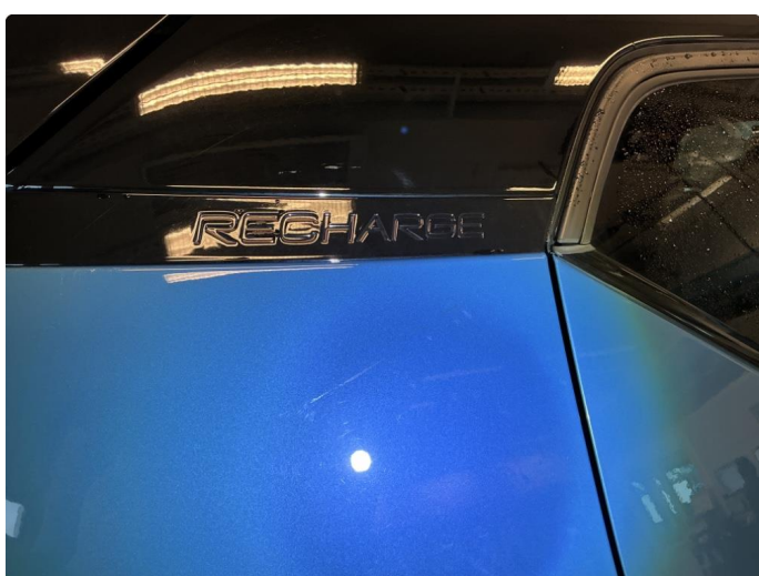
1.5 Liten ripe/bruksmerke