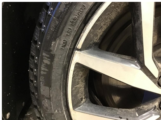
1.1 Liten skade på felg