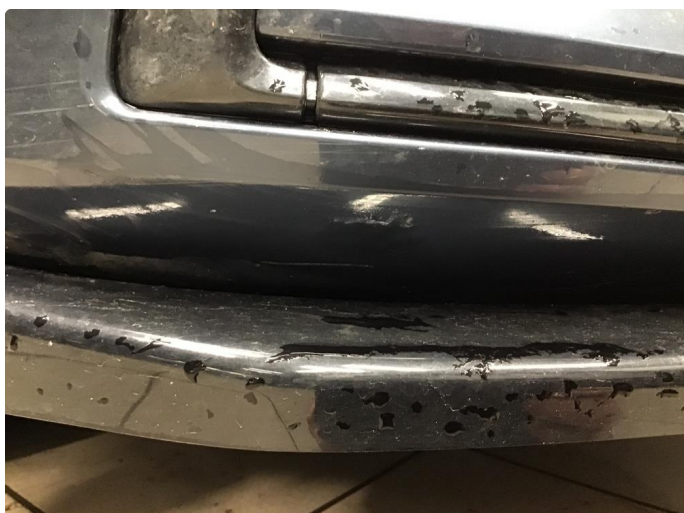
1.2 Liten ripe