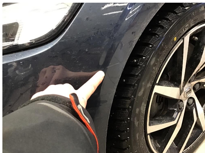
1.2 Liten ripe