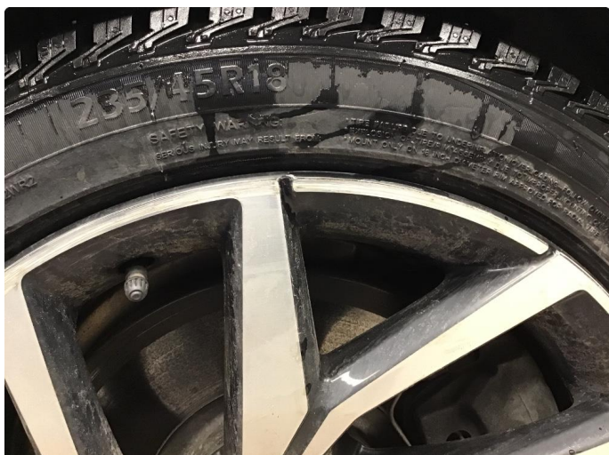
1.1 Liten skade på felg