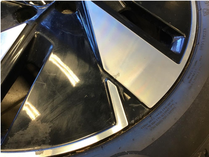
1.1 Noen små riper på felg