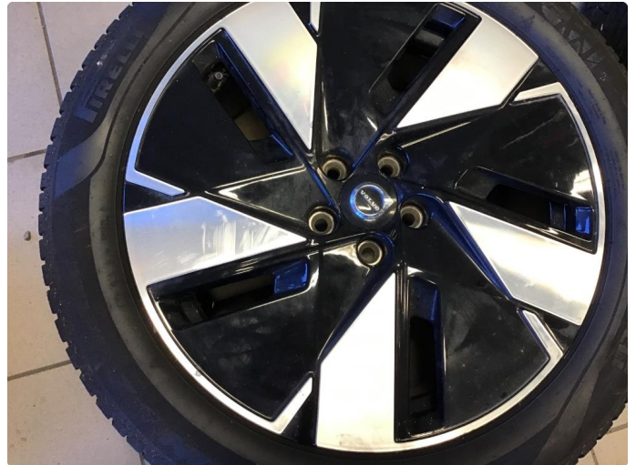
1.1 Noen små riper på felg