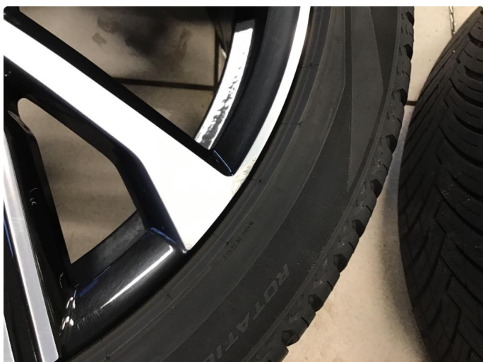
1.2 Liten skade på felg