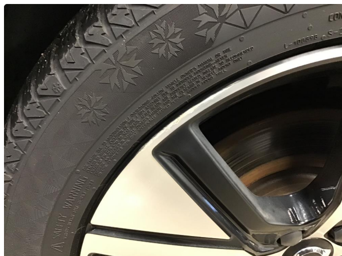
1.1 Liten skade på felg