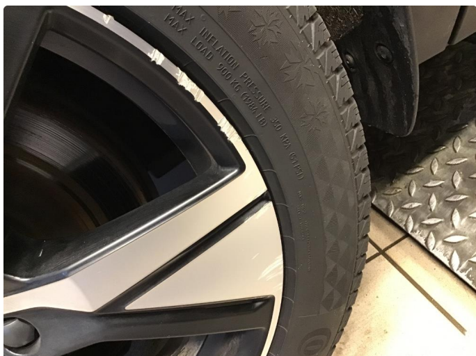
1.1 Liten skade på felg