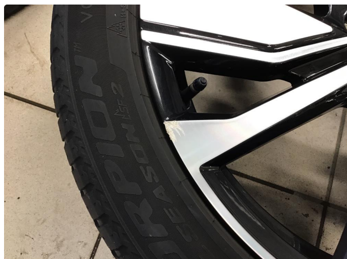
1.2 Liten skade på felg