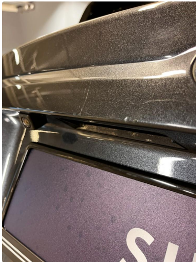
1.3 Hakk i øvre del