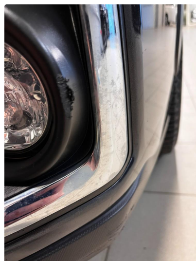
1.6 Ripe på plastdetaljer ved tåkelys