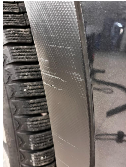
1.4 Noen riper i plastdetaljer, venstre foran