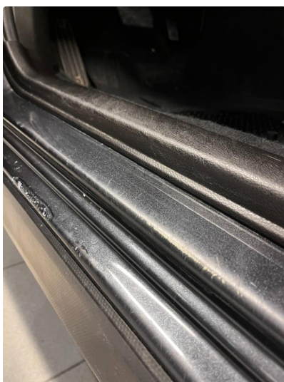
1.5 Litt slitt dørterskel førerside, normalt etter alder og km