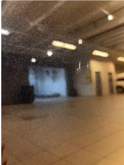
1.1 Riper høyre bakdør