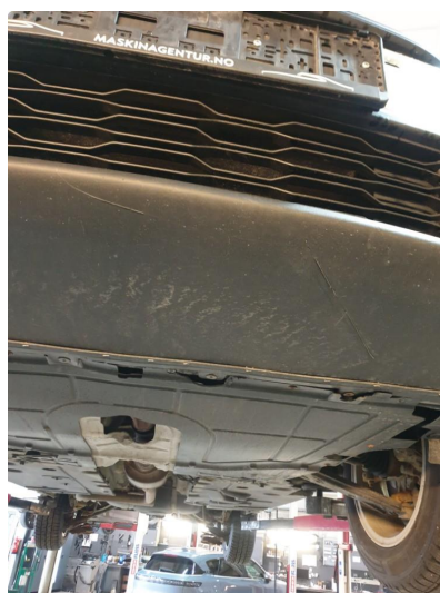
1.2 Skrubbskader underkant