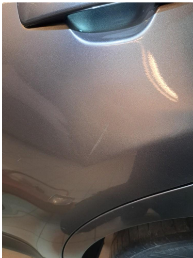
1.2 Flere bulker