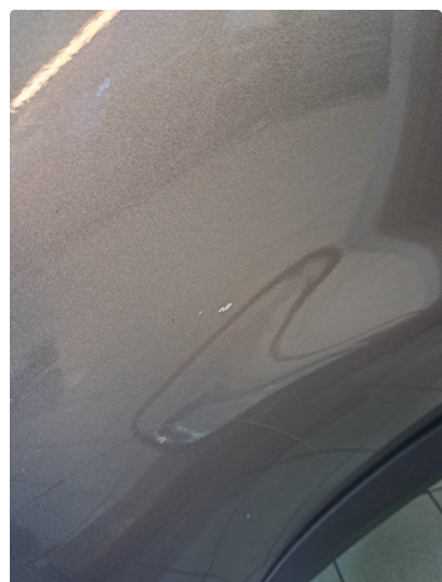
1.2 Flere bulker