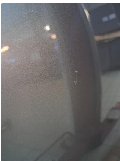
1.2 Flere bulker