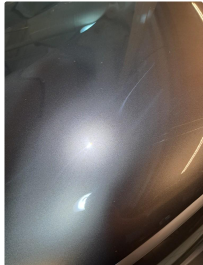
1.2 Flere bulker