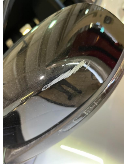
1.2 Speilhus riper