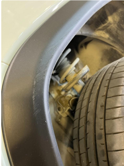
1.1 List mangler/skadet